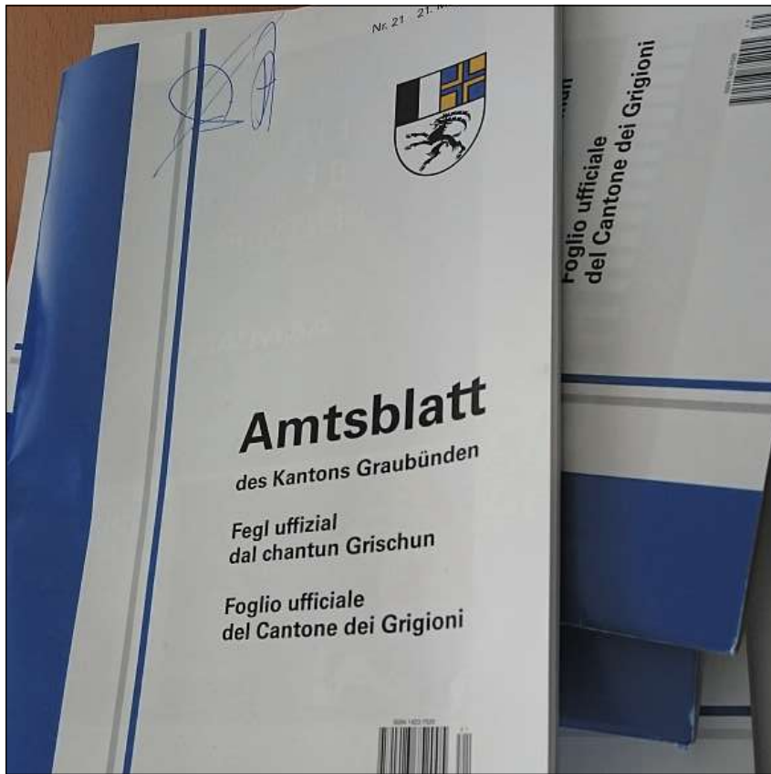
Il fegl ufficial cantunal sin pupi ei in organ che vegn legius e consultaus stediamein. Naven digl onn 2016 datti el mo pli electronicamein.

■ El preventiv cantunal ei l'informaziun publicada: Ina sligaziun cun interpresa generala hagi la consequenza ch'ei detti neginas investiziuns pil cantun. La cefra ella colonna dil fegl ufficial cantunal pigl onn 2015 ei vita. Tuttina sco il calender statal e la collecziun da leschas dil cantun Grischun duei uss era il fegl ufficial cantunal cumparer egl avegnir mo pli en fuorma electronica. Dapi 200 onns cumpara el ella medema fuorma, numnadamein sin pupi. Il fegl ufficial cantunal ei in organ da publicaziun che vegn legius stedi. Igl ei in impurtont organ, quei malgrad che la materia ei pilpli schetga e formala. Impressaris san s'informar leu nua ch'ei san ir per lavur, crediturs nua ch'ei san ir per daners e catschadurs e pescadurs nua ch'els san reter las patentas. Il fegl ufficial cantunal cuntegn era las damondas da baghegiar per objects ordeifer la zona e publicaziuns dallas vischnauncas en connex cun projects e proceduras dalla planisaziun locala. La part cullas mutaziuns dil register cantunal da commerci miran biars per meraviglias. Seigi per meraviglias ni per interest professional: Igl organ vegn sfegliaus stedi nua ch'el ei. Tgi che consultescha buca quei fegl ufficial cantunal munchenta magari pintgas sensaziuns. El ei buca mo da leger ellas canzlias communalas e tiels ufficis cantunals. Era per fiduziaris eis ei in impurtont organ, el ei savens era sin meisa ella stanza da spetga da dentists, miedis e coiffeurs.